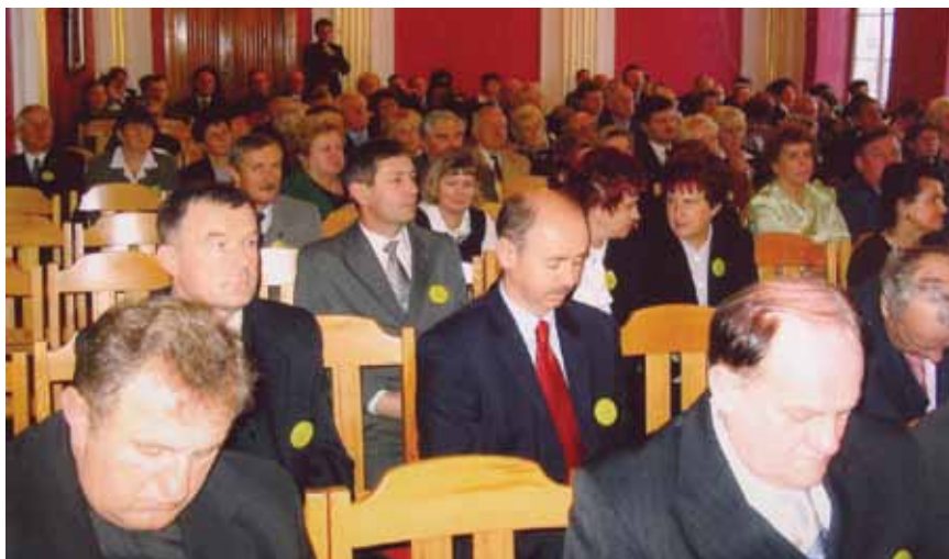
Uroczystość 15-lecia SRKDP.