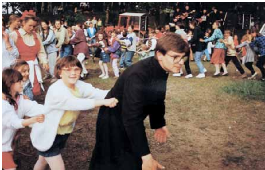
Festyn rodzinny w parafii św. Marcina w Gostyninie.

Dużym zainteresowaniem cieszą się spotkania dekanalne członków Stowarzyszenia, podczas których odbywa się pogłębianie formacji duchowej i organizacyjnej. Do dużych atrakcji należy zaliczyć organizowane bale karnawałowe o charakterze charytatywnym dla mieszkańców Gostynina.