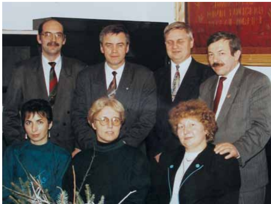
Zarząd Polskiej Federacji Stowarzyszeń Rodzin Katolickich.