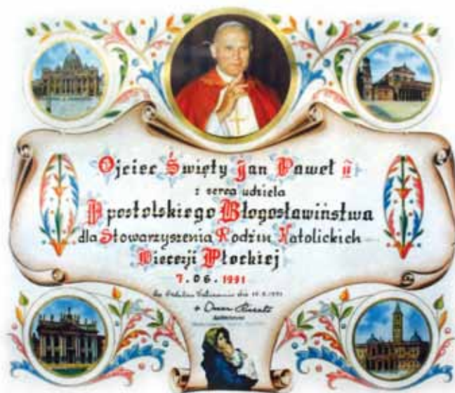
Apostolskie błogosławieństwo Papieża Jana Pawła II dla SRKDP.