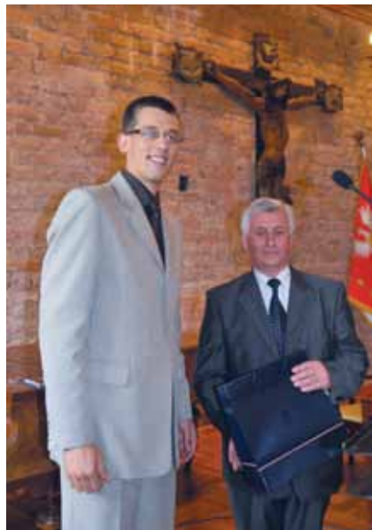
Przedstawiciel kancelarii Prezydenta RP wręcza list gratulacyjny.

nomii, murarstwa wykończeniowego oraz ogrodnictwa i konserwacji zieleni. Po rocznym cyklu szkolenia uczestnicy Centrum uzyskiwali kwalifikacje potrzebne do zatrudnienia w danym zawodzie lub nabierali umiejętności do prowadzenia samodzielnej działalności. Z programu szkoleń reintegracyjnych skorzystało ok. 50 osób wywodzących się z grona bezrobotnych. Na adaptację budynku i rozpoczęcie działalności Centrum, Stowarzyszenie otrzymało środki z Ministerstwa Pracy i Polityki Społecznej, oraz od Samorządu Województwa Mazowieckiego. Po trzech latach działalności Centrum Integracji zaprzestało działalności z powodu braku pozyskania środków z Europejskiego Funduszu Społecznego oraz z braku zainteresowania tym przedsięwzięciem przez władze gminy i lokalnego środowiska społecznego.