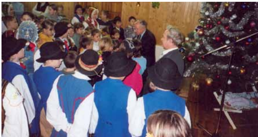
Choinka w Harcerskim Zespole Dzieci Płocka.