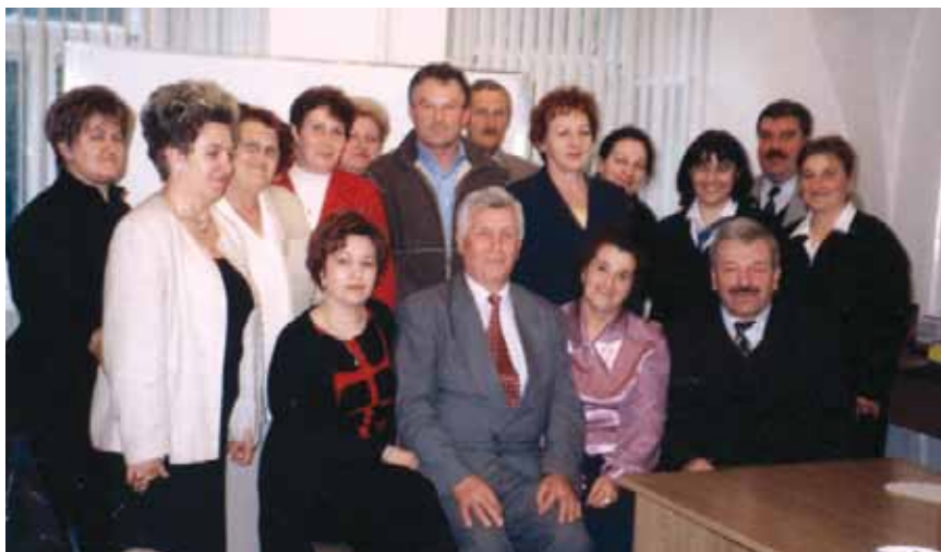
Zarząd SRKDP VIII - kadencji

Nowy lokal był bardzo obszerny o pow. około 110 m kw., w skład którego wchodziło 6 pomieszczeń, w których urządzono: biuro, poradnię rodzinną, świetlicę komputerową, zaplecze gospodarcze, łazienkę i salę konferencyjną. W tych warunkach lokalowych pojawiła się duża możliwość prowadzenia pożytecznej działalności.