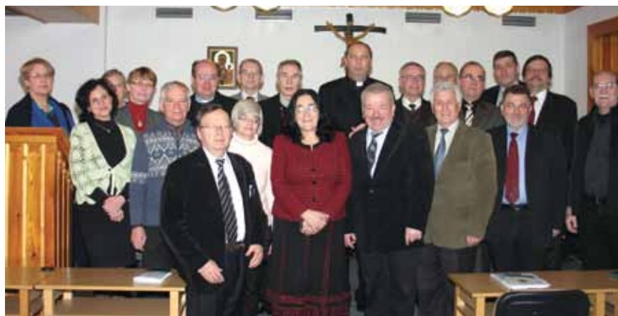
Rada Prezesów Polskiej Federacji SRK w Zakopanem

Poradnia rodzinna świadczyła usługi rodzinom i osobom samotnym będącym w trudnych sytuacjach życiowych – porad udzielali prawnicy, psychologowie i pedagodzy. W poradni rodzinnej prowadzone były konferencje i kursy przedmałżeńskie w których uczestniczyły