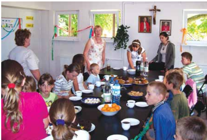
Dzieci w świetlicy SRKDP

W 2007r Zarząd Główny zapoczątkował nowatorskie zadanie poprzez zorganizowanie na terenie gminy Gozdowo pow. sierpecki Centrum Integracji Społecznej. Na potrzeby CIS, uzyskano w dzierżawę budynek o powierzchni około 1000 m kw. po byłej szkole podstawowej w miejscowości Kolczyn. Centrum Integracji Społecznej zajmowało się szkoleniami reintegracyjnymi osób z wykluczenia społecznego – długotrwale bezrobotnych bądź uwikłanych w różne rodzaje uzależnień. Szkolenia odbywały się w trzech grupach zawodowych – gastro-