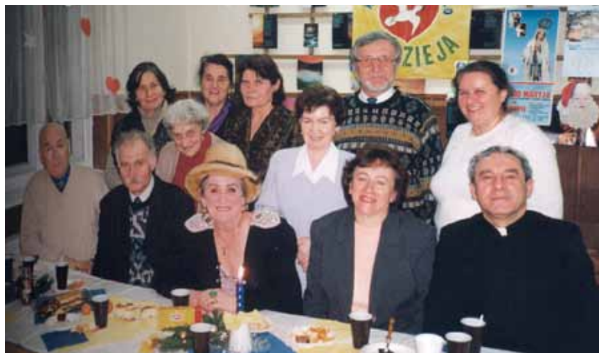
Spotkanie w parafii św. Jana Chrzciciela w Płocku.