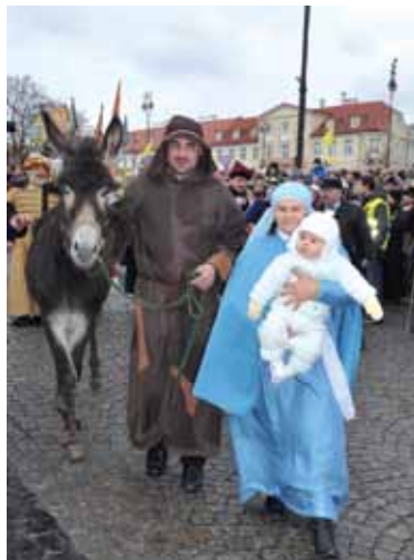
Orszak Trzech Króli 2012.