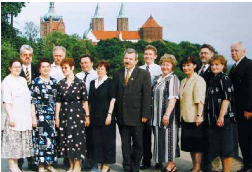
Zarząd SRKDP V kadencji.

macji przygotowuje materiały promocyjne dla księży, które będą wykorzystane w czasie kole-dy. Ciecchanów z kolei gości całe Stowarzyszenie na wielkim balu sylwestrowym.