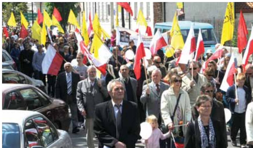
Marsz dla Życia i Rodziny 2013.

Kończąc swoje reminiscencje z przebiegu działalności SRKDP pragnę podziękować Panu Bogu za daną mi łaskę do pełnienia funkcji prezesa i radość z osiąganych dobrych efektów ale również i za trudne doświadczenia, które nauczyły pokory i wytrwałości w działaniu, a przede wszystkim za ludzi z którymi dane mi było owocnie współpracować. Jako prezes pragnę podziękować osobom szczególnie oddanym pracy w Zarządzie Stowarzyszenia w ostat-