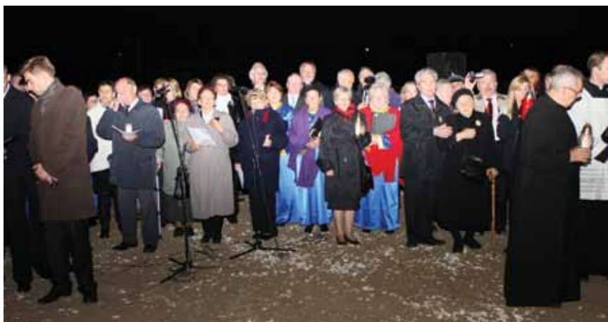
Z poświęcenia Płockiego Parku Pamięci Katyń - Smoleńsk 2010 w Płocku - Trzępowie.