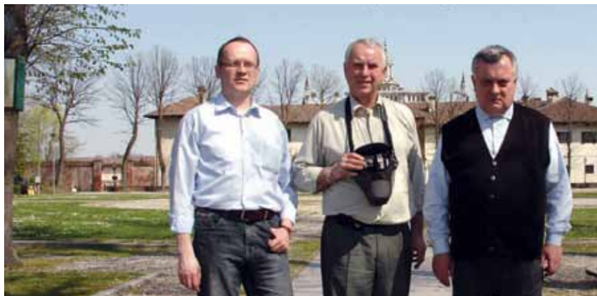
Organizatorzy pielgrzymki do św. Joanny Beretty Molla.

Równoległe z pracą Zarządu Głównego SRKDP odbywała się praca w kołach parafialnych. Każde koło parafialne ma inną formę działania zależną od specyfiki danej społeczności lokalnej. Koła parafialne SRKDP są ogniwami przenoszącymi misję Kościoła na płaszczyznę społeczną. Przez nawiązywanie kontaktów następuje zbliżenie laikatu ze wspólnotą