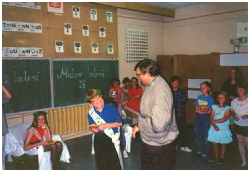
Działalność Koła Parafialnego przy parafii św. Piotra w Ciechanowie.