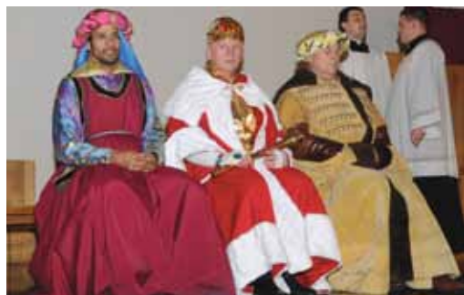
Orszak Trzech Króli 2014.