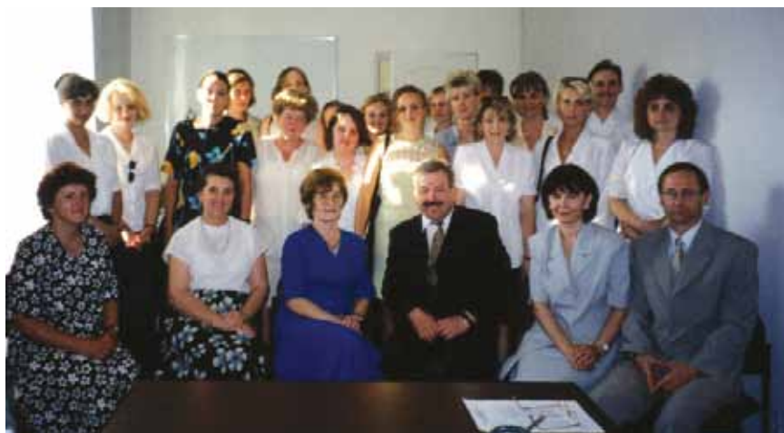
Sluchacze i nauczyciele studium menadżerskiego SRKDP.