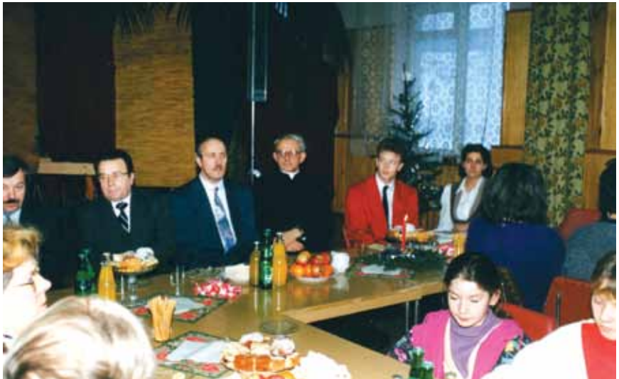
Spotkanie opłatkowe w Rypinie.

gać i współpracować, a dzieci i młodzież wychowane w tej atmosferze, nie trzeba zmuszać do uczestnictwa w życiu Kościoła.