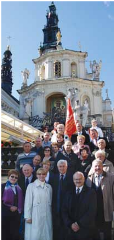
Pielgrzymka na Jasną Górę.

nizacji w następnym okresie. Kadencja władz Stowarzyszenia trwa cztery lata. Po czwartym roku kadencji Walne Zgromadzenie dokonuje wyboru nowego prezesa i członków zarządu.