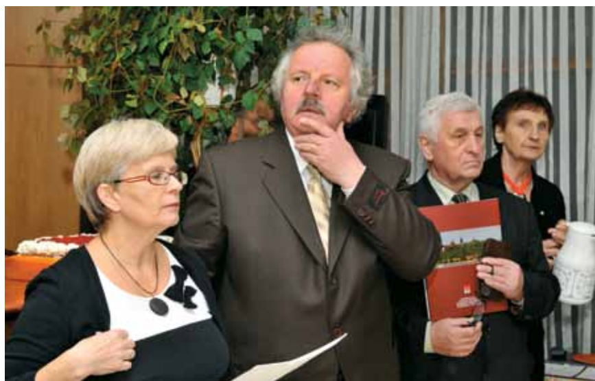
Wieczór poświęcony „Tym którzy odeszli do Pana” w parafii św. Jadwigi Królowej w Płocku 2013r.

Kończąc swoje reminiscencje z przebiegu działalności SRKDP pragnę podziękować Panu Bogu za daną mi łaskę do pełnienia funkcji prezesa i radość z osiąganych dobrych efektów ale również i za trudne doświadczenia, które nauczyły pokory i wytrwałości w działaniu, a przede wszystkim za ludzi z którymi dane mi było owocnie współpracować. Jako prezes pragnę podziękować osobom szczególnie oddanym pracy w Zarządzie Stowarzyszenia w ostat-