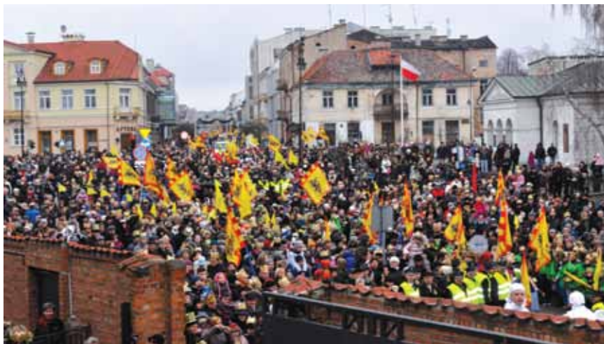
Orszak Trzech Króli 2013.

Swoistym wyzwaniem dla Stowarzyszenia Rodzin Katolickich Diecezji Plockiej jest obrona życia od poczęcia do naturalnej śmierci. Wstąpienie Polski do Unii Europejskiej przyspieszyło przepływ nowych laickich kierunków ideologicznych, opartych o relatywizm moralny. Kręgi rządzące naszym państwem nie przeciwstawiają się tym nowym ideologiom, a tym samym sprzyjają szerzeniu się zła moralnego. Zainteresowane tym nowe kręgi kulturowe za-