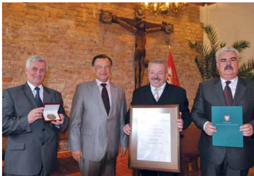
SRKDP otrzymało medal Marszałka Województwa Mazowieckiego „PRO MAZOVIA”.

Członkowie Zarządu Głównego SRKDP uczestniczyli osobiście w misyjnej akcji „Adopcja na odległość” opłacając