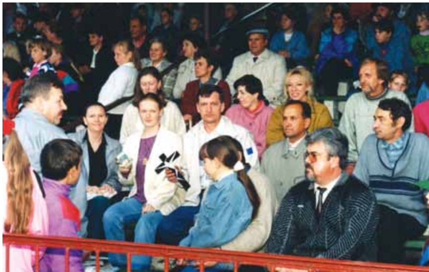
Festyn rodzinny w Rypinie.

wplyw na decyzje dotyczące spraw wszystkich mieszkańców. Z posród członków Stowarzyszenia wybierani są radni, ławnicy w sądzie, wójt, starosta oraz dyrektorzy i kierownicy jednostek pracujących na terenie miasta.